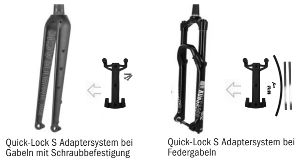
Quick-Lock S Adaptersystem bei Gabeln mit Schraubbefestigung