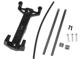
Quick-Lock S Adapterplatte inkl. Befestigungszubehör (im Lieferumfang enthalten)