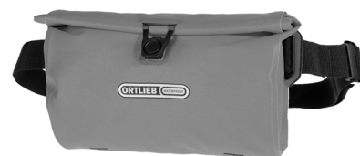
Velo-Sling Flex 2,5 Liter

Inklusive austauschbarer Innentasche mit zwei Netz- und einem Reißverschlussfach