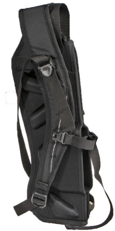
Le système de transport se replie à plat