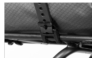
Détail du Rack-Straps monté sur le porte-bagages