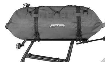
Dry-Pack monté sur le porte-bagages