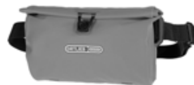
Velo-Sling Flex 2,5 litre

Poche intérieure interchangeable incluse avec deux filets et un compartiment zippé